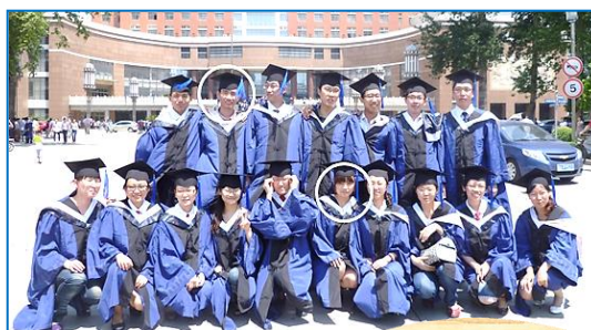
修士課程卒業写真 (上〇 李さん 下〇 奥様)

学部16、大学院博士課程42、修士課程68のコースです。学生数は本科生9781人、留学生300人(日本、韓国等)です。教職員は8000人を超え学生の指導にあたっています。附属病院は5ヶ所あります。